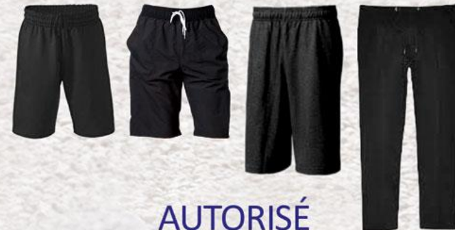
Modèle et couleur identiques