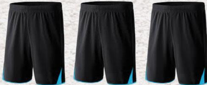
Modèle et couleur identiques