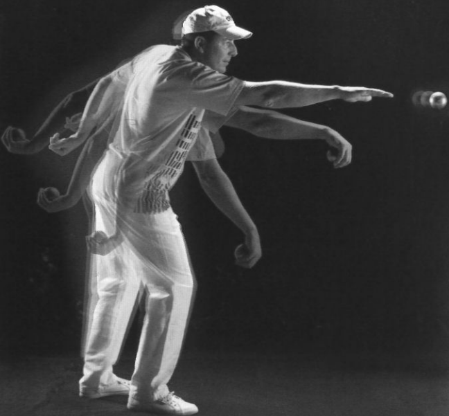
Philippe Suchaud, Champion du Monde